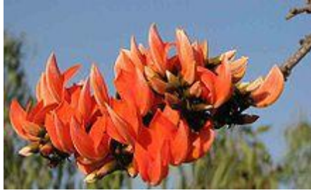
ดอกทองกวาว ดอกไม้ประจำจังหวัดเชียงใหม่