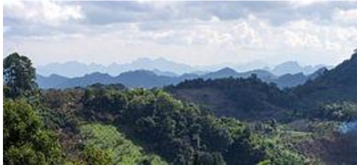
เทือกเขาแดนลาวในเขตอำเภอไชยปราการ

จังหวัดเชียงใหม่มีพื้นที่ 20,107.057 ตารางกิโลเมตรหรือประมาณ 12,566,911 ไร่ มีพื้นที่กว้างใหญ่เป็นอันดับที่ 1 ของภาคเหนือ และเป็นอันดับ 2 ของประเทศ รองจากจังหวัดนครราชสีมา ลักษณะภูมิประเทศโดยทั่วไปมีสภาพพื้นที่เป็นภูเขาและป่าละเมาะ มีที่ราบอยู่ตอนกลางตามสองฟากฝั่งแม่น้ำปิง มีภูเขาที่สูงที่สุดในประเทศไทยคือ ดอยอินทนนท์ สูงประมาณ 2,565 เมตร อยู่ในเขตอำเภอจอมทอง นอกจากนี้ยังมีดอยอื่นที่มีความสูงรองลงมาอีกหลายแห่ง เช่น ดอยผ้าห่มปก (อำเภอฝาง) สูง 2,285 เมตร ดอยหลวงเชียงดาว (อำเภอเชียงดาว) สูง 2,170 เมตร ดอยสุเทพ (อำเภอเมืองเชียงใหม่) สูง 1,601 เมตร สภาพพื้นที่แบ่งออกได้เป็น 2 ลักษณะคือ